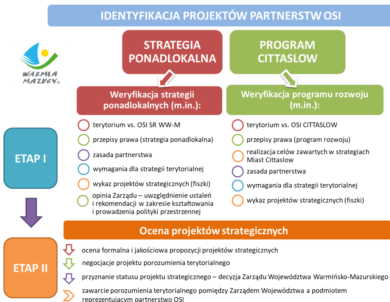
Rysunek 2. Etapy identyfikacji projektów partnerstw OSI obejmujące weryfikację strategii ponadlokalnych/programu rozwoju oraz ocenę projektów strategicznych