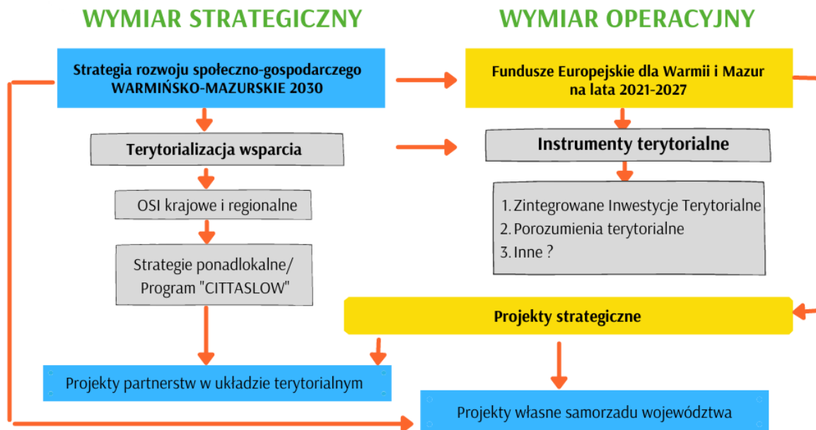
Rysunek 1. Zarządzanie rozwojem województwa warmińsko-mazurskiego do roku 2029 w wymiarze strategicznym i operacyjnym - schemat procesu identyfikacji projektów strategicznych